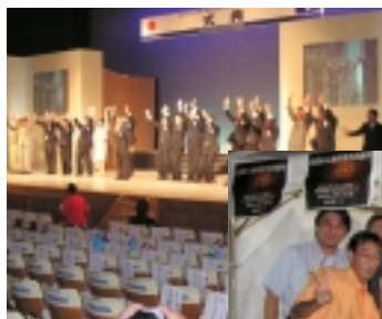
東北青年フォーラム 式典の様様